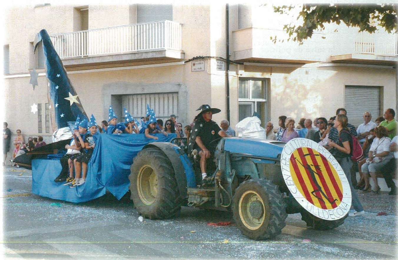
Carrossa de festes del C.C.R.